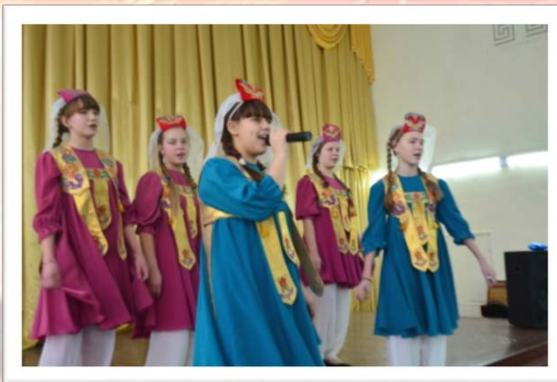
Праздничное мероприятие «День Семьи!»