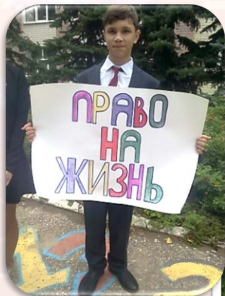
Акция « Мои права»